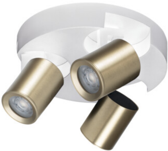
LAURIN EL-30 W-G