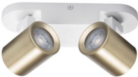
LAURIN EL-2I W-G