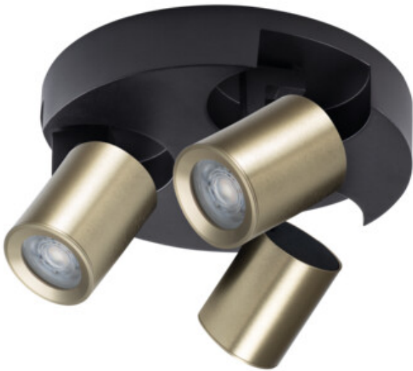
LAURIN EL-30 B-G