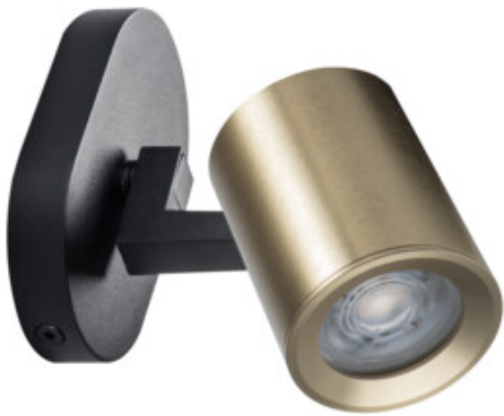
LAURIN EL-10 B-G