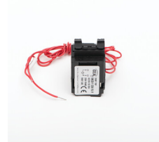
36300 KMCCB-F-250A/UV wyzwalacz podnapięciowy