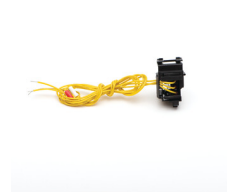
36297 KMCCB-F-250A/AX/L styk pomocniczy