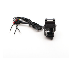
36306 KMCCB-F-250A/RL/R wyzwalacz napięciowy