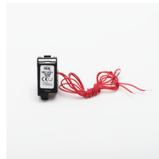
36296 KMCCB-F-125A/UV wyzwalacz podnapięciowy