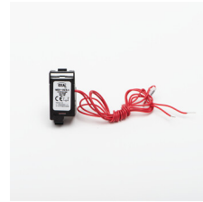
36296 KMCCB-F-125A/UV wyzwalacz podnapięciowy