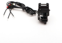
36306 KMCCB-F-250A/RL/R wyzwalacz napięciowy