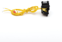
36297 KMCCB-F-250A/AX/L styk pomocniczy