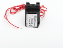
36300 KMCCB-F-250A/UV wyzwalacz podnapięciowy