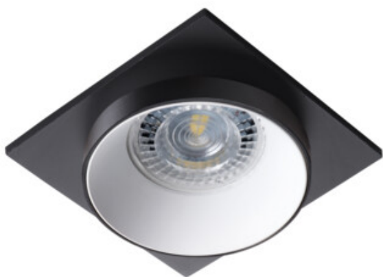
SIMEN DSL B/W/B