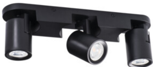
LAURIN EL-3I B