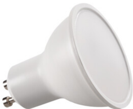
TOMlv2 6,5W GU10