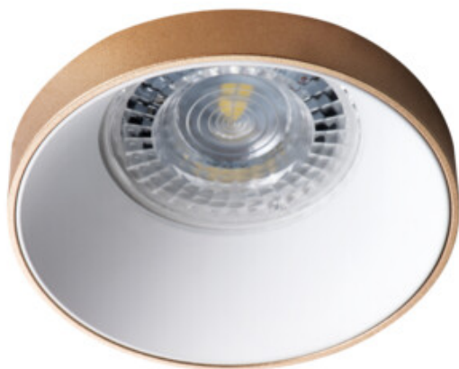
SIMEN DSO G/W